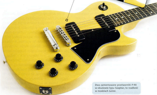
Dwa zamontowane przetworniki P-90 w obudowie typu Soapbar, to rzadkość w modelach Junior.

Niewątpliwą zaletą „malucha” w porównaniu do „dużego” LP jest jego waga wynosząca około 3,3 kg. Stare Les Paule, jak również ich reedycje, słyną z tego, że są bardzo ciężkie. Z Juniorem na pasku można spokojnie spędzić trzy godziny bez przerwy i nie grozi to konsekwencjami w postaci obolałego karku.